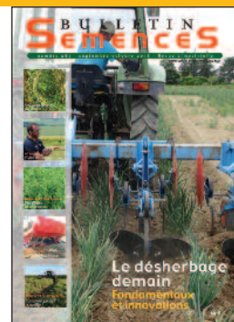
Christian Etourneau / FNAMS