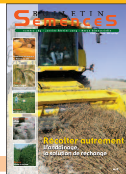
Christian Etourneau / FNAMS