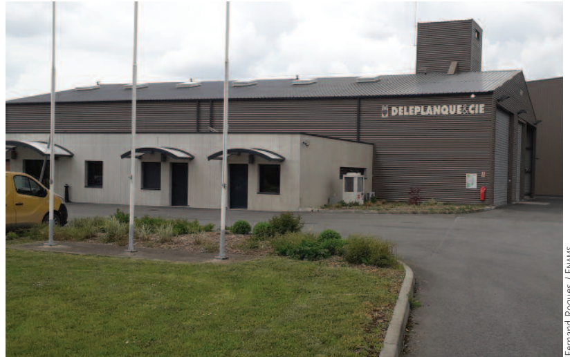
La station de Villefollet (Deux-Sèvres) permet d'assurer sur place les étapes de réception, triage, traitement, conditionnement, certification et dispose depuis 2018 d'un laboratoire d'analyses.