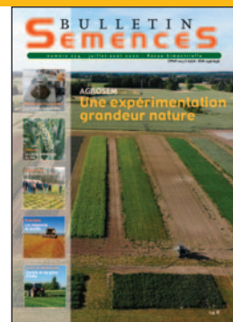
Laura Brun / FNAMS